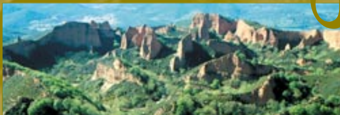
Explotación aurífera de las Médulas