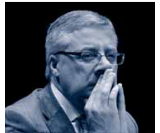
El ministro de Fomento, José Blanco.

El recorte del presupuesto inversor para infraestructuras será fuente de conflictos con las comunidades autónomas. De hecho, ya ha tensado las relaciones con Cantabria. Su presidente, Miguel Ángel Revilla, ya advertido de que romperá su alianza con el PSOE si Fomento anula su compromiso de llevar el AVE hasta Santander. Pero, de momento, intenta buscar soluciones para abaratar costes. Ayer, Revilla calificó de «sensata» la propuesta de los empresarios palentinos de no soterrar la línea a su paso por Palencia y Venta de Baños, construir una sola estación y sacar la línea al extrarradio, medidas con las que se ahorrarían 450 millones.