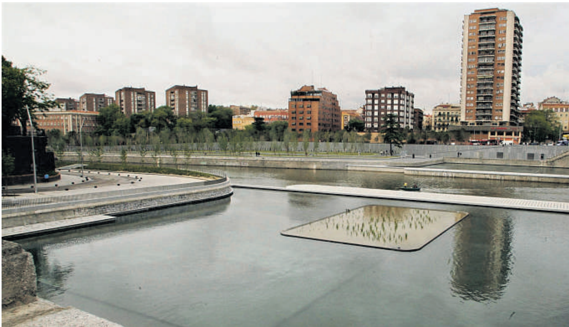
Vista de la zonas ajardinadas y los estanques que rodean el Puente de Segovia