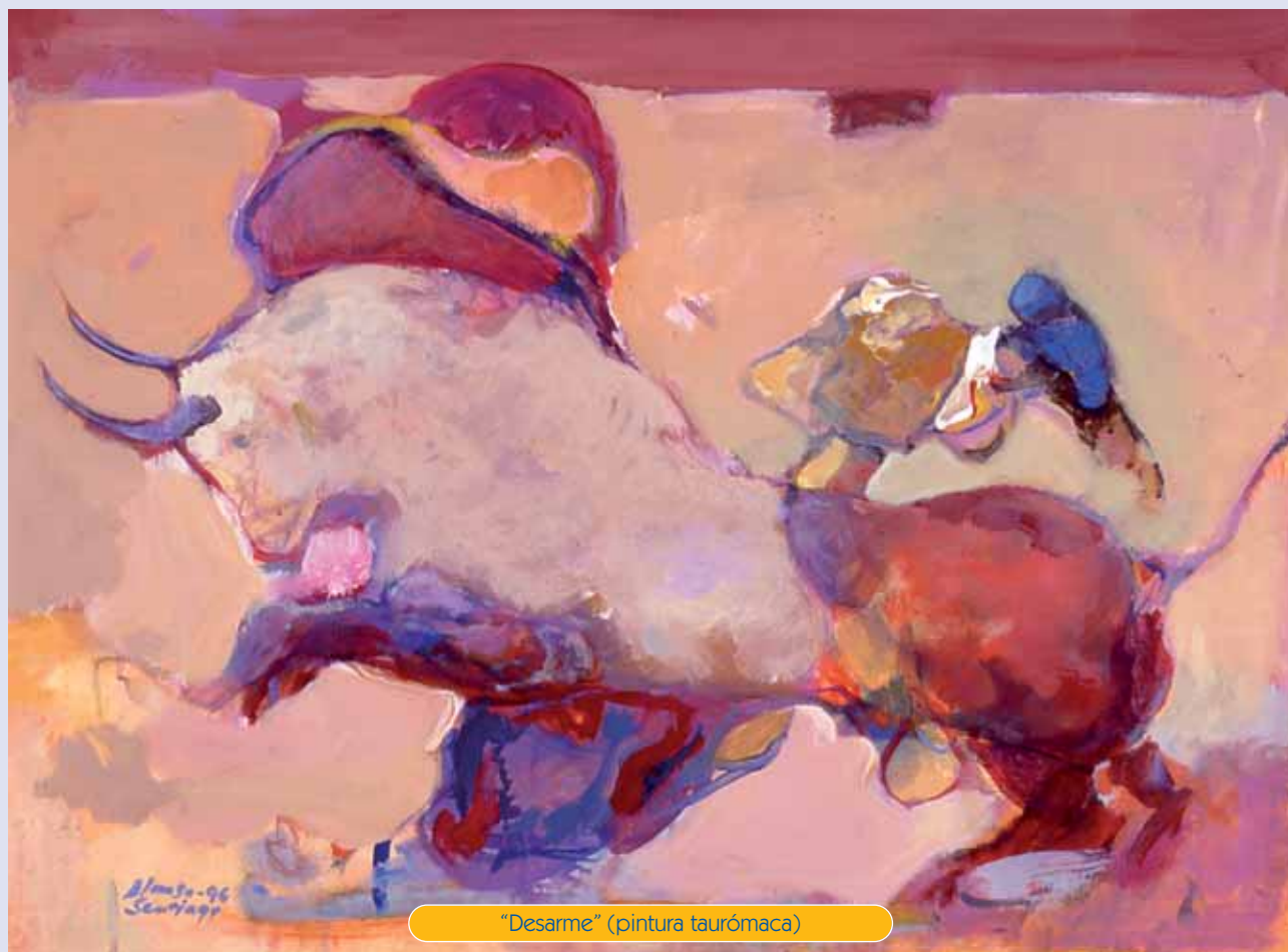
"Desarme" (pintura taurómaca)

Las palabras, a veces, clarifican y, a veces, confunden. De ahí mi intento de buscar las mejores. Convergamos en que lo taurómaco es del mundo de la pintura y lo taurino del mundo del toro. ■