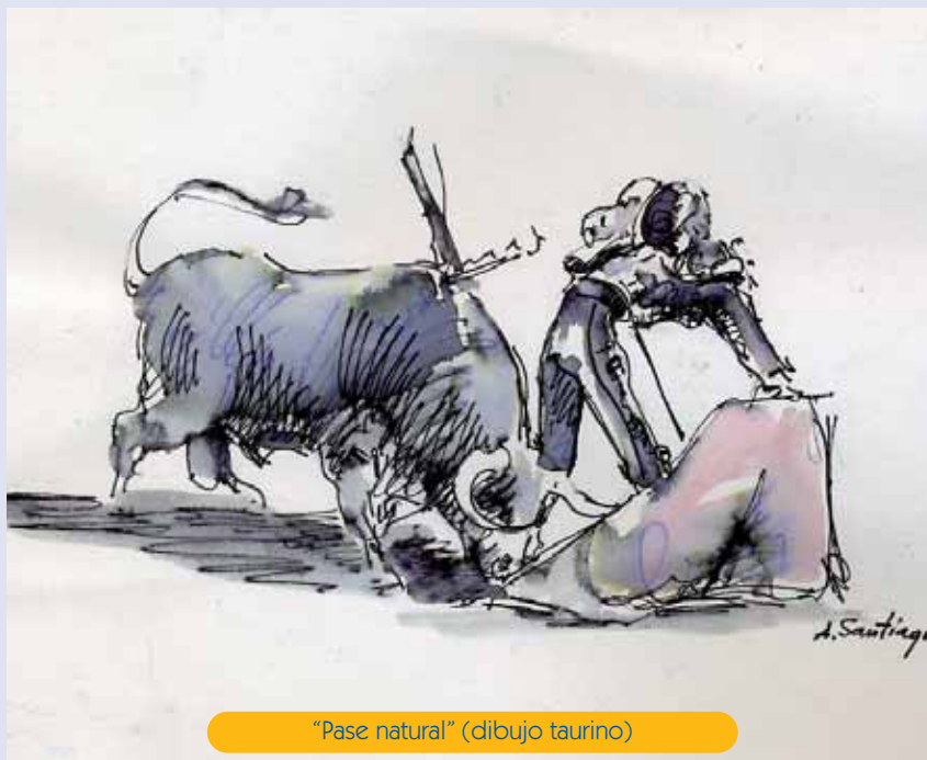
"Pase natural" (dibujo taurino)

Desde antes de Guisando, la presencia del toro en España ha dejado una huella a la que no han sido ajenos artistas extranjeros. Poetas, narradores, músicos, cineastas, fotógrafos y, naturalmente, pintores y escultores, han sido seducidos